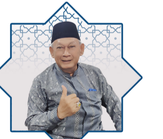
Manajemen Akhlakul Karimah oleh: H. Ahmad Chairudin

Dr. Nuridin juga mengajak seluruh elemen masyarakat untuk berperan aktif dalam upaya pencegahan dan pemberantasan narkoba. "Narkoba adalah ancaman bagi generasi muda kita," tegasnya. (Abdul)