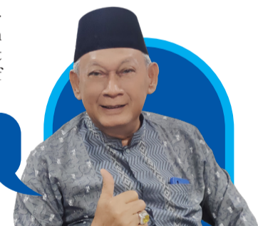
Manajemen Akhlaqul Karimah Oleh : H. Ahmad Chairudin

Mudah-mudahan Allah SWT senantiasa mengatkan iman kita, hingga kita dalam menjalankan kehidupan ini senantiasa bersandar kepada aturan Allah SWT dan senantiasa menerima dengan ikhlas keputusan Allah SWT.***