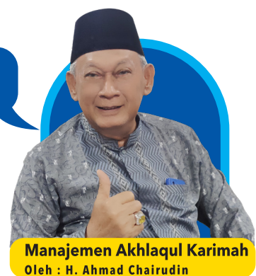
Manajemen Akhlaqul Karimah Oleh : H. Ahmad Chairudin

Selain meninjau pembangunan RSUD, Dr. Nurdin, yang turut didampingi Kepala Dinas PUPR Kota Tangerang, juga memantau progres perbaikan Jalan Garuda yang berada di Kecamatan Batu Ceper. Perbaikan jalan ini diharapkan dapat meningkatkan aksesibilitas dan mobilitas warga setempat, serta mendukung aktivitas ekonomi di kawasan tersebut. (Abdul)