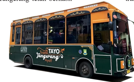
BERSAMBUNG KE HAL 9

Kepala Dinas Kebudayaan dan Pariwisata (Disbudpar) Kota Tangerang Rizal Ridoloh menjelaskan, keramas massal merupakan tradisi masyarakat Kota Tangerang khususnya warga Kampung Babakan yang sudah dilakukan secara turun temurun.