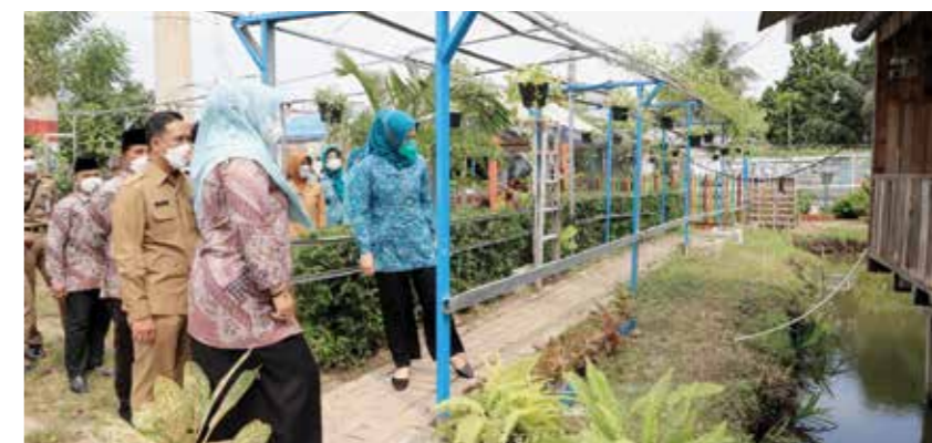
Kampung Jimpitan KB2, Kecamatan Batu Ceper.

Kunjungan tersebut salah satunya adalah untuk melakukan studi tiru di