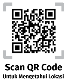
Scan QR Code Untuk Mengetahui Lokasi

Aviari ini juga menjadi salah satu wujud kepedulian lingkungan untuk menjaga alam di sekitar tetap terjaga keasriannya. (Alfian Pratama)